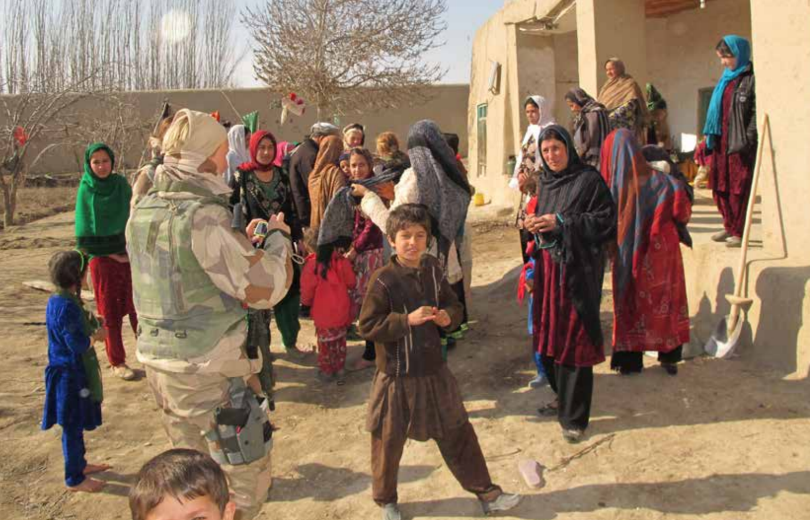
I de olika byarna blev vi bemötta på många olika sätt. Några var öppna och glada för att vi var där, andra bemötte oss med stor misstänksamhet. Vid möten försökte vi alltid att "avväpna" oss så mycket vi kunde, men varje möte krävde sin avvägning.