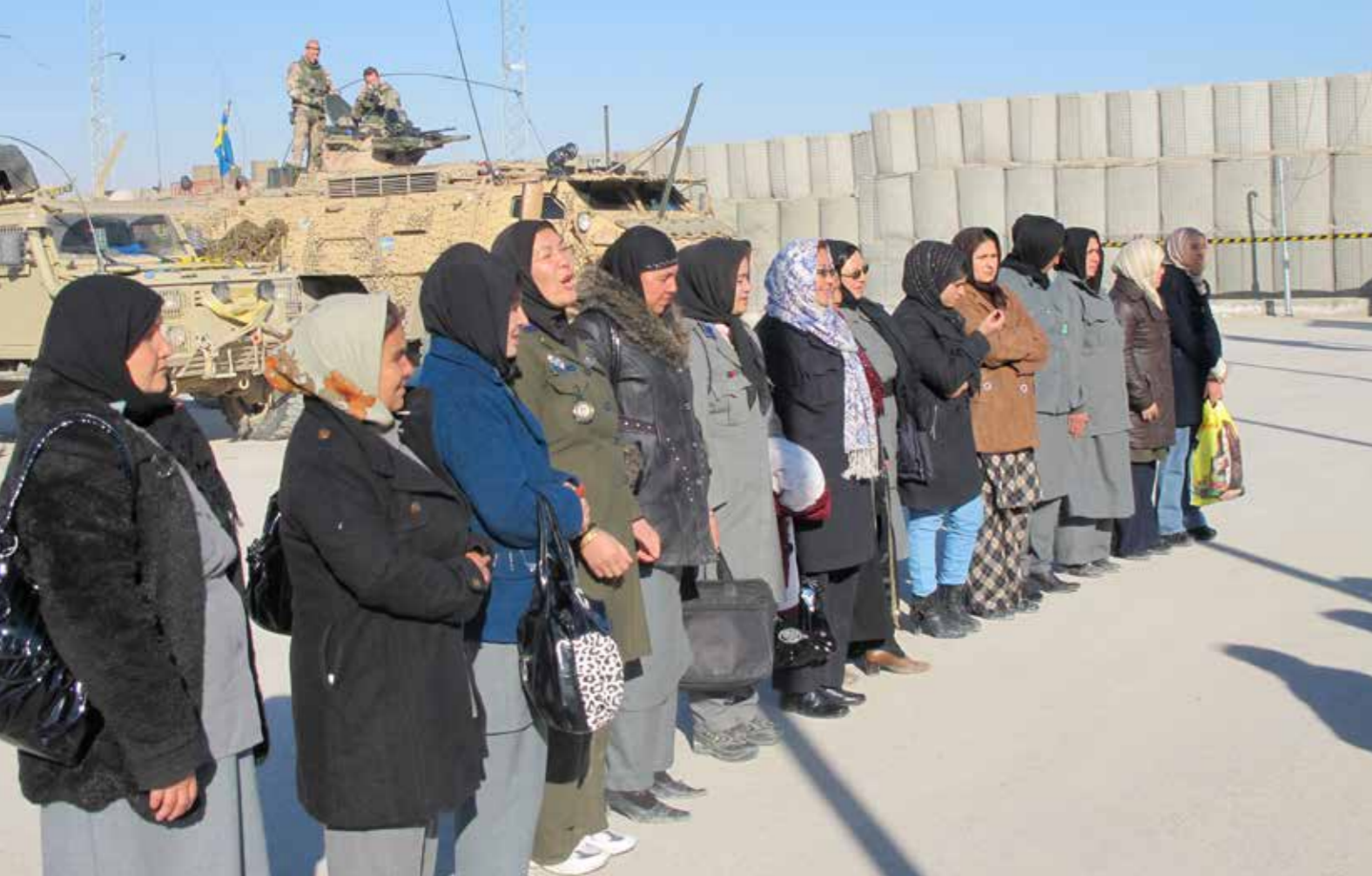
Svenska kvinnliga soldater och officerare genomförde utbildning med afghanska kvinnor i bland annat sjukvård. "Eleverna" var en salig blandning, allt ifrån poliser till "butiksbiträden". Historier och livsöden som dessa kvinnor delade med sig, är oförglömliga. Jag har sällan träffat på så mycket positivism, framåtanda och sjuk humor.