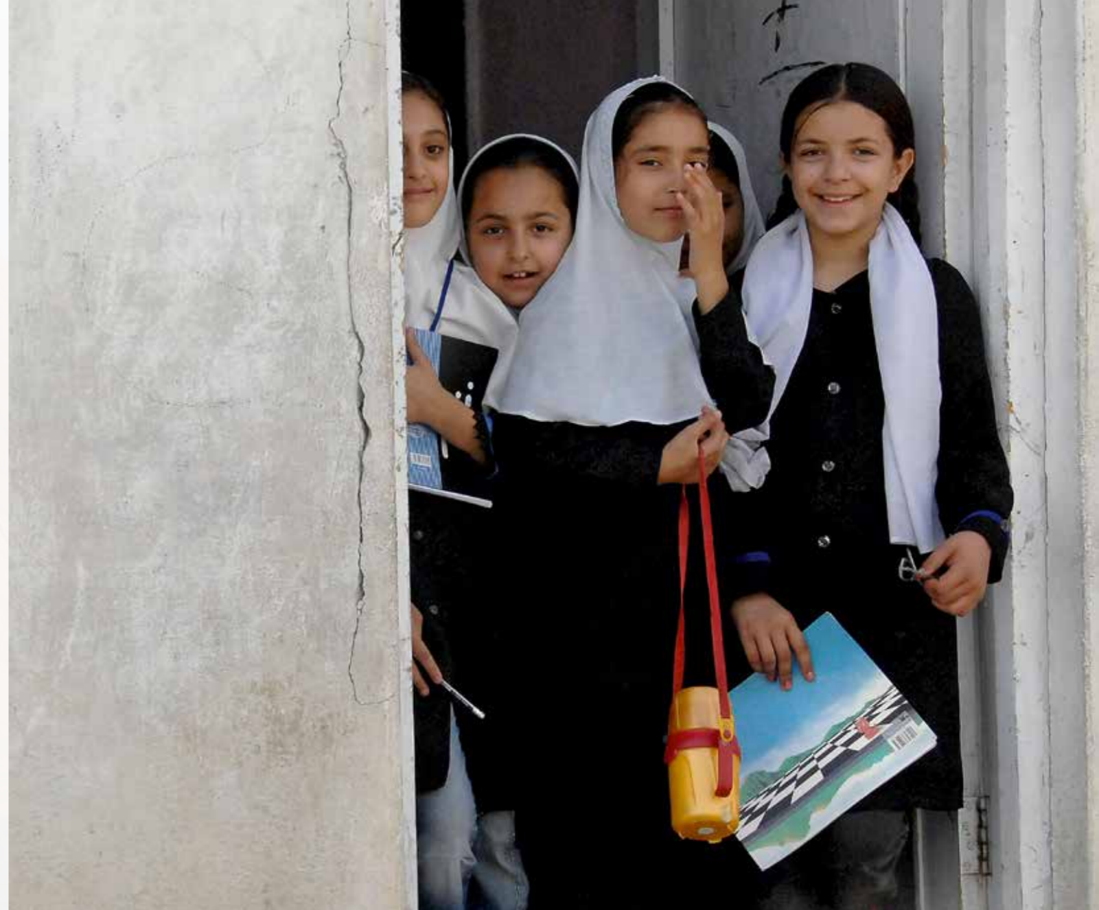
Hur kommer skolgången se ut för afghanska flickor i framtiden?

norna, men min mans andra hustru dödade den. Från en lokal kvinno-organisation har vi fått veta kön och ålder på barnen i fängelset. Barnen får nu påsar med kläder som vi tänkt oss skulle passa. Ett par små pojkar blir väldigt stolta över att få bära keps. Mammor klagar över att någon annans barn fick en bättre klänning. De kvinnliga fångvaktarna talar om för oss att de minsann också har barn där hemma.