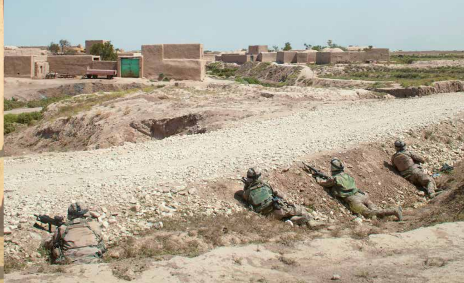
Skydd på riktigt!

här fallet insatsen i Afghanistan, arbetar tillsammans med forskare för att utforska det ämne som man vill utveckla nya kunskaper om.