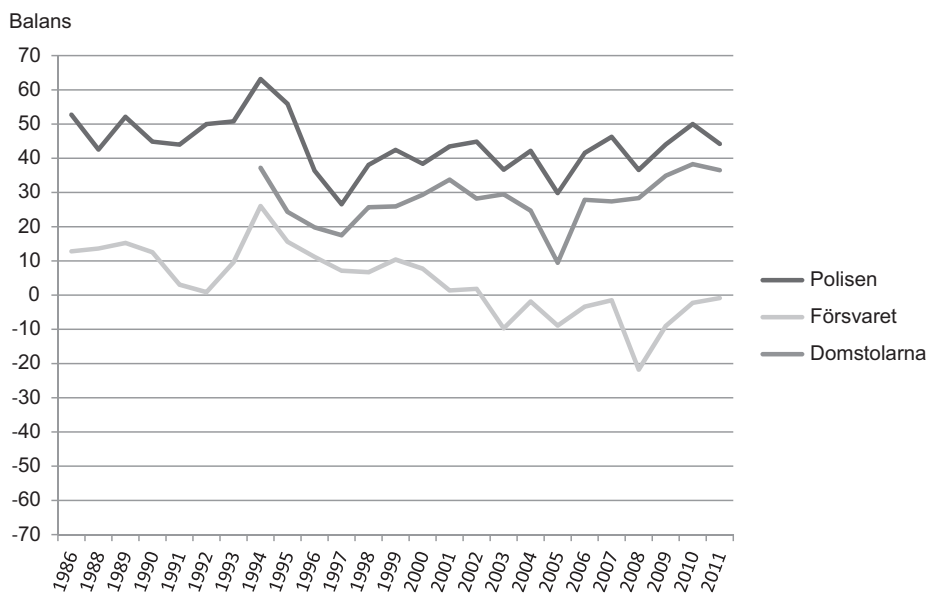
Figur 1 Förtroendet för försvaret, polisen och domstolarna 1986-2011 (balansmått)

Kommentar: Figuren visar förändringar i förtroende för polisen och försvaret 1986-2011 samt domstolarna 1994-2011 utifrån SOM-institutets mätningar. Balansmålet visar andelen som har ganska eller mycket stort förtroende minus dem som har ganska eller mycket litet förtroende. Måttet kan variera mellan 100 (alla svarspersoner anger ganska eller mycket stort förtroende) och -100 (alla svarspersoner anger ganska litet eller mycket litet förtroende). Personer som svarat "varken eller" ingår inte i procentbasen. Frågan lyder: Hur stort förtroende har du för det sätt på vilket följande institutioner och grupper sköter sitt arbete?